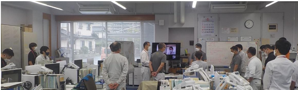
出雲市水道事業災害対策本部の設置