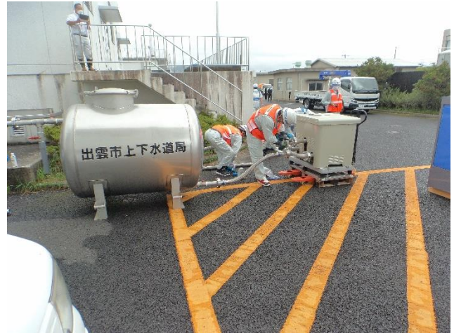
断減水地区への応急給水訓練