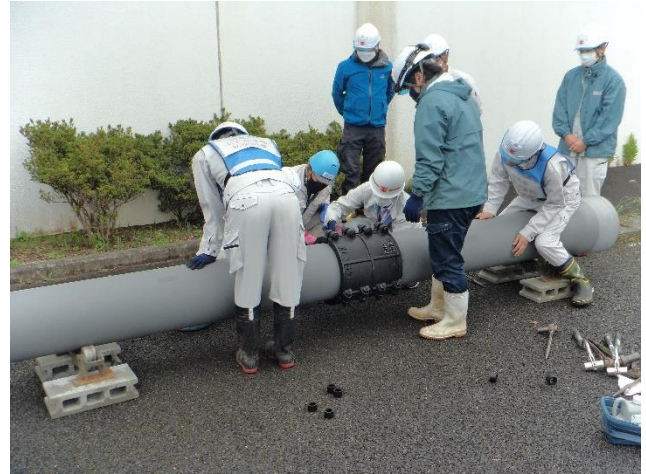
水道本管破損復旧訓練