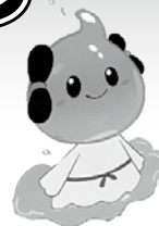
出雲市上下水道局キャラクター 「みずもちゃん」

最近、下水道への異物の流入によるポンプの故障や、油の流入による下水道管の詰まりが頻繁に発生しています。